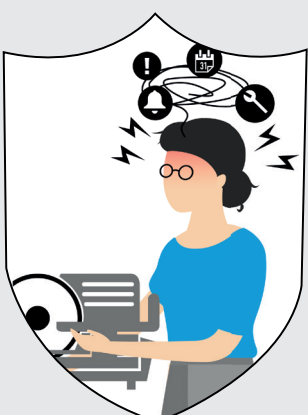
Entlastung im Arbeitsalltag