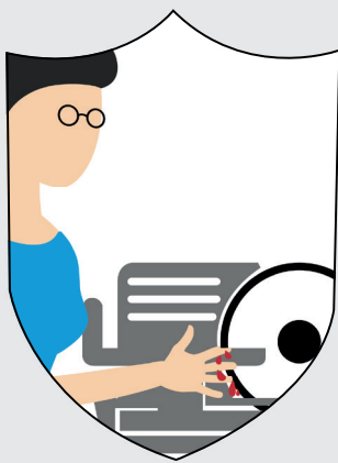
Schutz vor Arbeitsunfällen