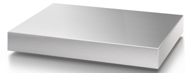
iL Precision 300F/SP

Der Single-Point Lastaufnehmer iL Precision 300F/SP ist für die Anwendung im Trockenbereich konzipiert: Für das kompakte Modell verwenden wir galvanisierten Stahl und eine DMS-Wägezelle aus Aluminium. Die sichtbare Glockenbrücke ist aus Edelstahl gefertigt. Neben seiner langlebig robusten Bauform überzeugt der Lastaufnehmer der Genauigkeitsklasse II durch seine hohe Auflösung bis zu 60.000d. Das macht ihn u.a. ideal für den Einsatz als Referenzwaage. Anders als vergleichbare Präzisionswaagen-Technologien erreicht der unkomplizierte iL Precision 300F/SP präzise Wägeergebnisse ohne Hebelwerk oder motorische Justiereinrichtung.