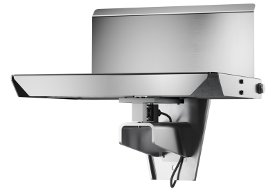
iL Special 150T/SP

Je nach Bedarf ist der eichfähige Lastaufnehmer iL Special 150T/SP in verschiedenen Wägebereichen erhältlich, als Zweibereichs- und Zweiteilungswaage. Der Lastaufnehmer unterstützt alle Bizerba Wägeterminals.