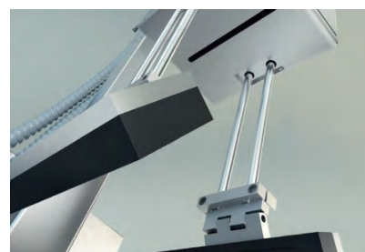
Funkcja Plug-In™ Label