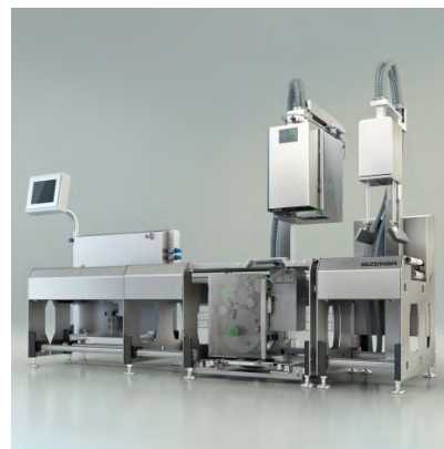
GLM-levo 200 1T1B

Inteligentna linia etykietująca GLM-levo, która została zaprojektowana z myślą o wazeniu oraz etykietowaniu towarów paczkowanych, jest dostępna w wielu wariantach. Dzięki modułowej konstrukcji, urządzenie można optymalnie dopasować do produktów oraz żądanej wydajności w przemyśle spożywczym. Modułowy system oraz wydajność do 200 opakowań na minutę sprawiają, że dla GLM-levo nie ma żadnych ograniczeń a tym samym wszystkie obecne i przyszłe żądania klientów zostaną w pełni zaspokojone. Urządzenie wyróżnia się nie tylko elastycznością, lecz także solidnością oraz designem, który znacznie ułatwia użytkownikom proces czyszczenia. Obsługa urządzenia została znacznie uproszczona, a ilość błędów w procesie pakowania zredukowana dzięki wizualnej kontroli jakości oraz automatycznej aktywacji danych procesowych za pomocą nowej funkcji „Plug-In™ Label”.