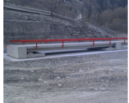
Standard Fahrzeugwaage Typ TSC-35 V

TSC-35 V ist die modulare Fahrzeugwaage für den Überfluraufbau. Sie bietet höchste Fertigungsqualität und ist schnell und einfach zu montieren. Profitieren Sie von maximaler Flexibilität: Die robuste Fahrzeugwaage ist in Längen von 6 bis 20 Metern verfügbar. Ab 14 m Länge ist eine Verbundwaage-Lösung möglich: Zwei folgende Einzelwaagen wiegen wechselseitig oder werden zum Verbund-Wiegen zusammenschaltet. Als einteilige Version lagert die Waagenbrücke auf zwei Fertigbeton-Kopfteilen. Bei mehrteiligen Waagen ergänzt ein Fertigbeton-Mittelteil sicher die Konstruktion. Sie erhalten die Waage variabel als Überfluraufstellung mit offenen Seiten oder Souterrain-einbau mit einer geschlossenen Längsseite (Hanglage). Dank der offenen Konstruktion der TSC-35 V auf beiden Seitenlängen und der Schutzart IP68 (Wägezellen), können Sie die Fahrzeugwaage effizient mit einem Hochdruckreiniger vom Schmutz befreien.