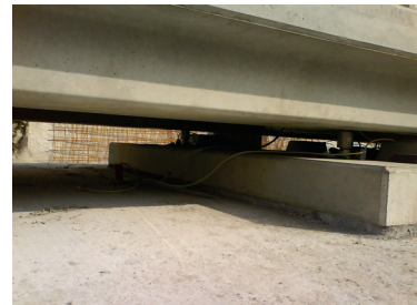
Kopfstück mit Wägezellenaufnahme